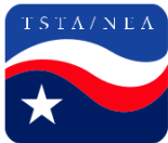
Texas State Teachers Association

Las siguientes organizaciones han aceptado las recomendaciones de este documento, pero no un proyecto de ley o propuesta legislativa específica.