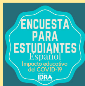
Encuesta para estudiantes