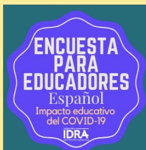
Encuesta para educadores