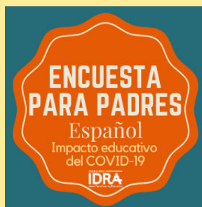
Encuesta para padres

Ahora, necesitamos su apoyo. Para garantizar una sólida asociación comunitaria en nuestro trabajo, tómese un momento para completar una encuesta, puede encontrar el enlace a continuación. Gracias.